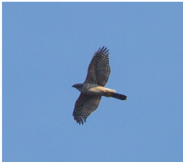
Autour des palombes, Accipiter gentilis , Poigny-la-Forêt – 78

À Fontainebleau – 77, 1 couple a mené 3 jeunes à l'envol, qui ont pu être observés entre le 26 juin et le 2 juillet (BLeb, RPan, MMSe).