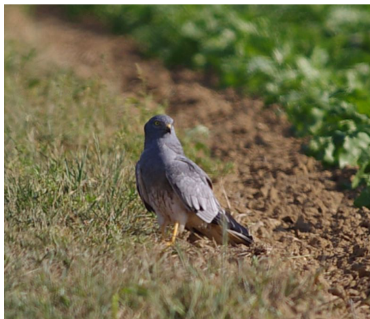
Busard cendré, Circus pygargus , Larchant – 77

Après l'émancipation des jeunes, l'espèce disparaît rapidement : le passage migratoire est réparti sur l'ensemble du mois d'août (peut-être même dès juillet), avec un pic dans la deuxième quinzaine du mois. Les dernières données sont répertoriées le 30 août à Boinville-le-Gaillard – 78 (CLet) et à Chatnonville – 91 (BDal).