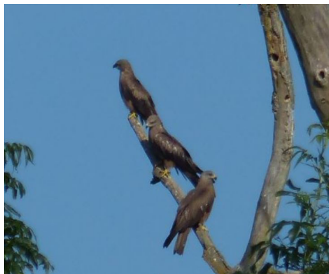
Milans noirs, Milvus migrans , Solers – 77

L’espèce est également connue pour ses départs précoces en Afrique : le passage a lieu de mi-juillet à fin août sans pic distinct, immédiatement après l’envol des jeunes. Un maximum de 27 ind. stationnant sur le site de la Butte-Bellot à Soignolles-en-Brie – 77 est noté le 23 juillet (JCre) ; en migration active, c’est à Fontaine-Fourches – 77 que le record est établi avec 11 ind. (ARob). Passé la mi-août, l’espèce se raréfie très rapidement, avec un dernier individu le 30 août à Pierre-Levée – 77 (JBot). Deux données exceptionnellement tardives sont toutefois à noter en addition de celle-ci : 1 le 10 octobre à Champcueil – 91 (BDal) et, surtout, 1 le 24 novembre à Gravon – 91 (SPla), ce qui représente l’une des données les plus tardives connues dans la région (Le Maréchal et al. , 2013).