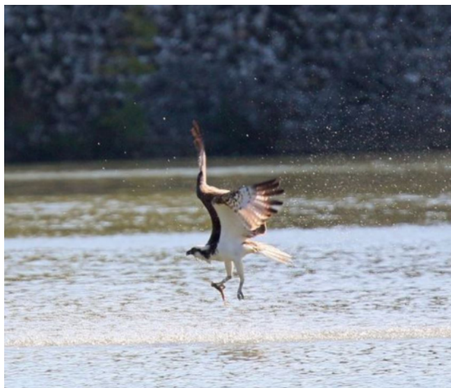
Balbusard pêcheur, Pandion haliaetus , Le Mesnil-Saint-Denis – 78

Le début du passage automnal est difficile à cerner en raison de la présence erratique d'individus au cours de l'été, mais on note un pic de données de la dernière décade d'août à la fin septembre. Le dernier oiseau est observé le 18 octobre à l'étang des Noës au Mesnil-Saint-Denis – 78 (GKer), ce qui est une date de dernier départ classique pour la région.