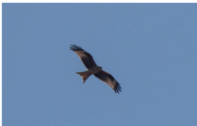
Milan royal, Milvus milvus , Cléry-en-Vexin – 95

Le passage printanier s'est déroulé du 23 février : 1 ad. à Orsonville – 78 (Tcha), au 14 mai : 1 ind. à Chevry-Cossigny – 77 (STho), avec un pic entre le 20 mars et le 20 avril.