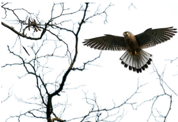
Faucon crécerelle, Falco tinnunculus , Tremblay – 93

Le passage postnuptial est un peu plus fourni et semble globalement précoce, avec un pic dans la première décade d'octobre et des extrema le 20 septembre à Gometz-le-Chatel – 91 (DLal, BDal) et le 8 novembre à Paris – 75 (GLes). L'espèce est répandue dans toute la région l'hiver, sans baisse d'abondance par rapport à la belle saison.