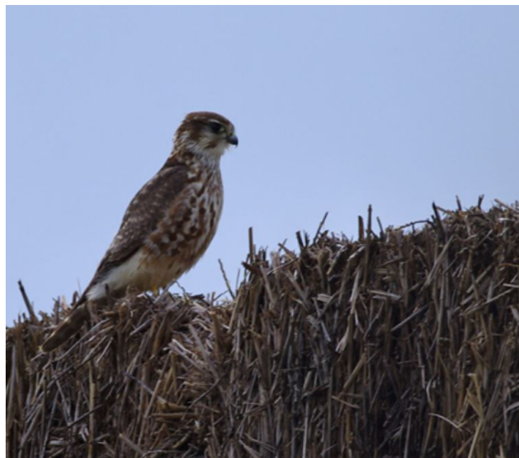
Faucon émerillon femelle, Falco columbarius , Obsonville – 77

Concernant le passage postnuptial, on note un nombre de données significativement plus élevé que d'habitude au mois de septembre, laissant clairement penser que le passage s'est déroulé particulièrement tôt en 2015. L'espèce est ainsi contactée à partir du 9 septembre à Nangis – 77 (JCre) et totalise 19 données sur l'ensemble du mois, contre entre 5 et 10 au cours d'une année « normale » de la décennie 2010. Le passage connaît un pic en octobre et se poursuit jusqu'à fin novembre, se confondant alors avec l'installation des hivernants.