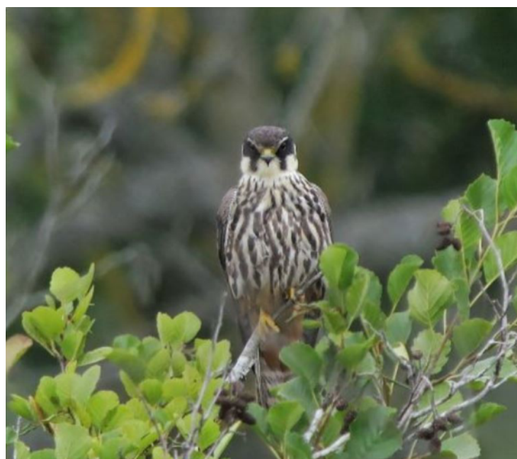
Faucon hobereau, Falco subbuteo , Écharçon – 91

Migrateur transsaharien strict car fortement dépendant des populations d'insectes pour son alimentation, le Faucon hobereau revient en France une fois le printemps bien installé. En 2015, il est signalé à partir du 6 avril à Neuilly-sur-Marne – 93 (CMal), ce qui est une date de première arrivée relativement précoce. Le passage s'intensifie ensuite brusquement passé la mi-avril et se prolonge jusqu'à la toute fin du mois de mai, avec un pic autour du 10 du mois. Un maximum de 11 ind. chassant des insectes ensemble est noté le 17 mai à Jablines – 77 (VLCa).