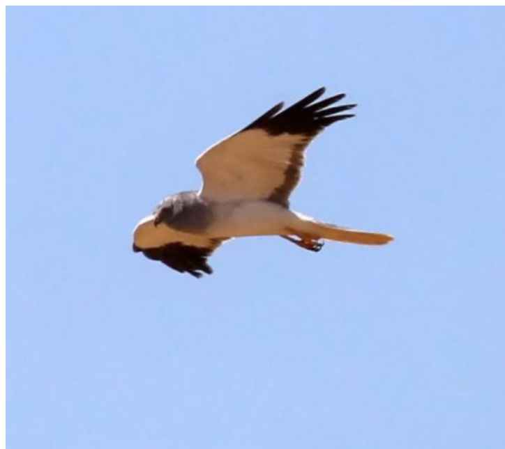
Busard Saint-Martin mâle, Circus cyaneus , Allainville – 78

En dehors de cela, les passages migratoires de l'espèce sont discrets (moins d'une dizaine de données d'oiseaux en migration par passage), et très certainement sous-détectés du fait de la confusion avec des individus locaux. À titre indicatif, les migrateurs printaniers sont notés du 8 mars à Auffargis – 78 (BDal) au 30 avril à Cernay-la-Ville – 78 (BDal) et les automnaux du 27 septembre à Montreuil – 93 (DTho) au 7 novembre au même endroit (DTho).