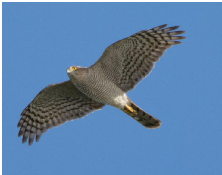
Épervier d'Europe, Accipiter nisus , Saclay – 91