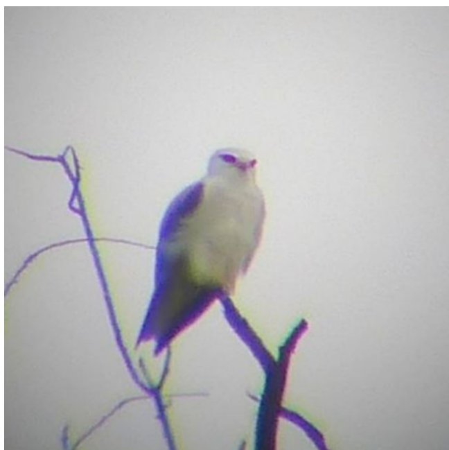
Élanion blanc, Elanus caeruleus , Évry-Grégy-sur-Yerre – 77

Une seule donnée en 2015 pour cet occasionnel en expansion en provenance du Sud-Ouest et d'Espagne, amené à devenir de plus en plus régulier dans notre région : 1 ind. est observé le 8 mai à Évry-Grégy-sur-Yerre – 77 (STho). L'oiseau est observé chassant pendant une heure, puis il prend de l'altitude et se dirige vers le sud ; il ne sera jamais retrouvé.