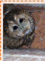
Sauvetage d'une chouette hulotte coincée dans un conduit de cheminée, en 2016, par David Martin.

Si l'animal semble blessé ou trop affaibli pour s'envoler, il est nécessaire de le confier au centre de sauvegarde de la faune sauvage le plus proche. Placez l'oiseau dans un carton perforé et tapissé de journaux ou essuie-tout, puis contactez le centre de soins qui vous indiquera les démarches à suivre.